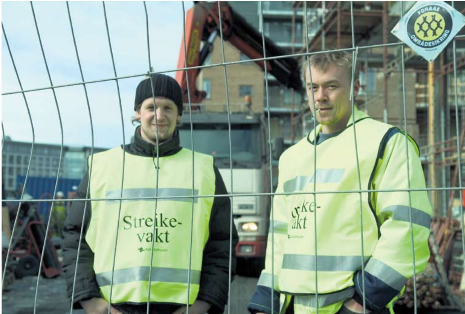
85%-kravet er et streikekrav!

En forklaring er oljeselskaperne og de store oppdragsgivernes kontrakt- og anbudspolitik. De fleste store jobbene blir ikke beskrevet i mengder, kvadratmeter og kubikk, slik at interesserte tilbydere kan regne en pris, og deretter utføre jobben med egen kompetanse og tjene penger på sin evne til effektivitet og planlegging. Nei, i denne bransjen er det langt mer vanlig at det gis estimater med antall timeverk, som det skal regnes på. Med andre ord, det regnes på hvor lavt timelønna kan legges for de enkelte disiplinene. I tillegg er det ofte langvarige kontrakter. Spørsmå-