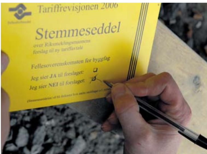
Medlemmene streiket for tømrrertariffen i 2006.