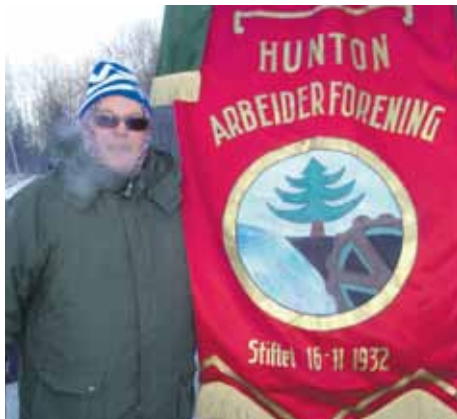
Størk Hansen Fellesforbundet avd. 678 Hunton Arbeiderforening & LO i Gjøvik, Land, Toten og Etnedal

Hvorfor har du tatt turen til Gjøvik for å støtte de streikende på Bekken & Strøm?