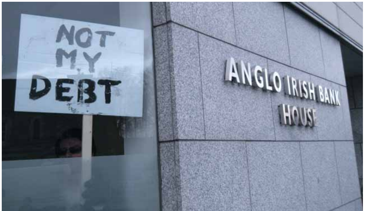
I Irland har privat gjeld blitt omdannet til statsgjeld. Det har ført til voldsomme nedskjæringer i velferdsstaten og kutt i minstelønnene. I protest har ulike «velferdsforsvarere» begynt å okkupere «zombie-bankene». Her fra byen Cork i det sydlige Irland.

– Vi skulle gjerne sett at den skatten var høyere. Men det er ikke noe du klarer å bygge en bevegelse rundt. Og er det noe folk her trenger nå, så er det å delta – og å se at deltagelsen deres har noe å si, at de kan være med å påvirke denne utviklingen i en annen retning.