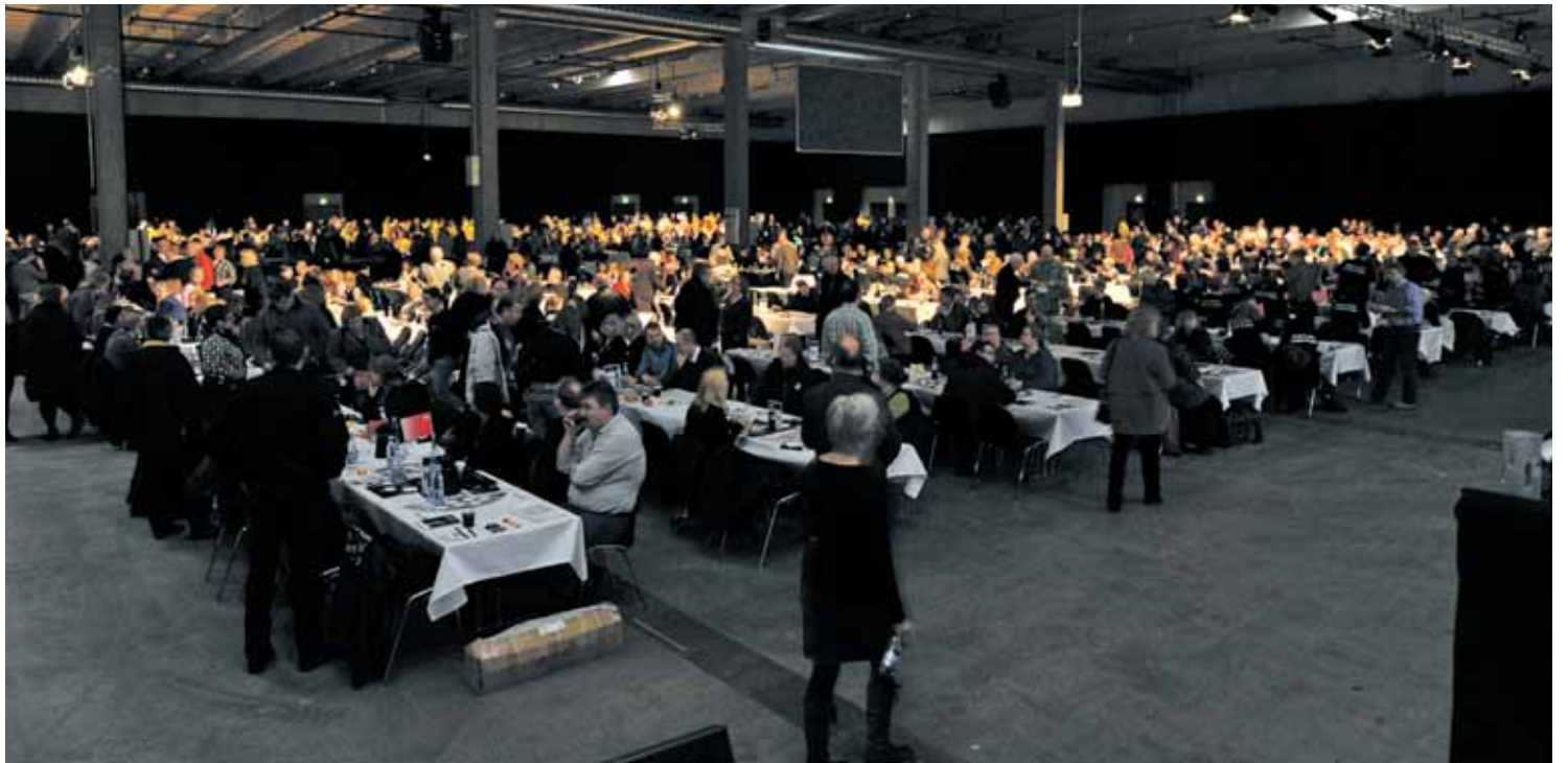
2. februar avholdt dansk LO et historisk stort tillitsmannsmøte i Odense med over 4000 deltagere. Møtet ble innkalt i protest mot den danske regjeringens bebudede pensjonsreform, som skal avskaffe danskernes versjon av AFP, den såkalte «etterlønnen». Møtet markerte starten på en omfattende kampanje i tiden som kommer, og spørsmålet vil helt sikkert prege den danske valgkampen som er i full gang.

Representantskapsmøtet i LO, 22.02.2011, slo fast hovedlinjene for årets mellomoppgjør. Sikring av kjøpekraften, kombinert med lav- og likelønnsprofil blir de sentrale oppgavene for LO i årets tariffoppgjør. Sekretariatet i LO fikk fullmakt til å vedta de endelige kravene. Disse vil bli overlevert Næringslivets Hovedorganisasjon 21. mars