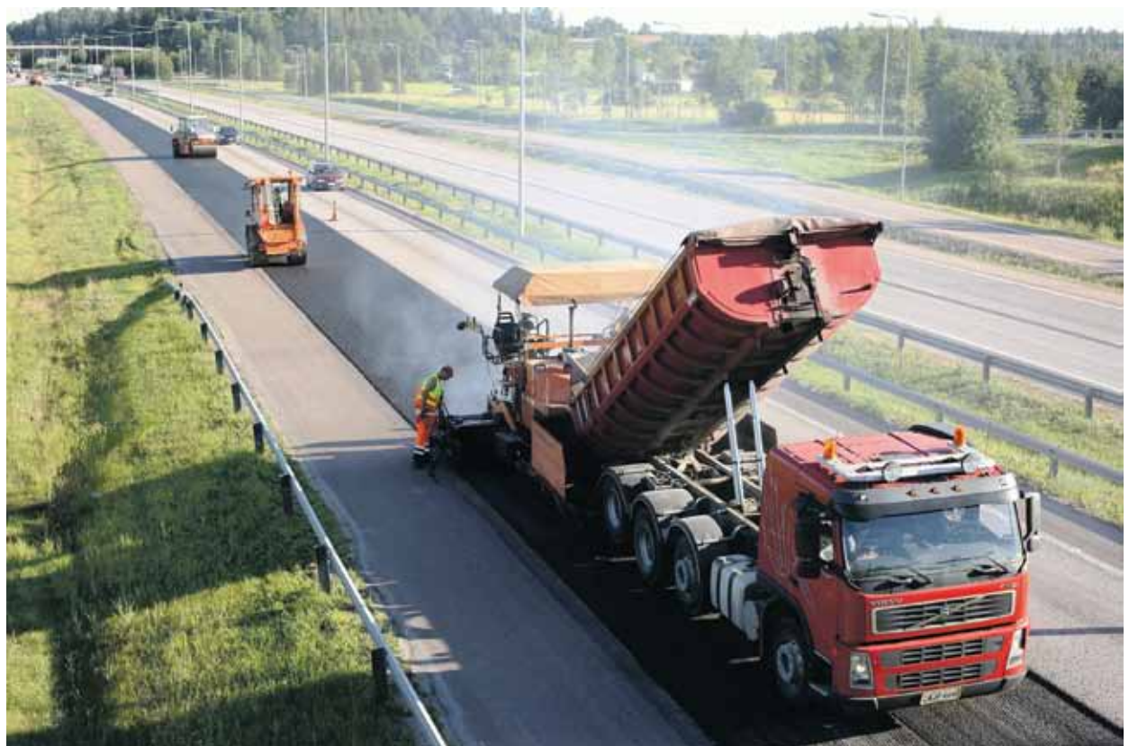
Lemminkäinen er et finsk storkonsern med filialer over hele verden.