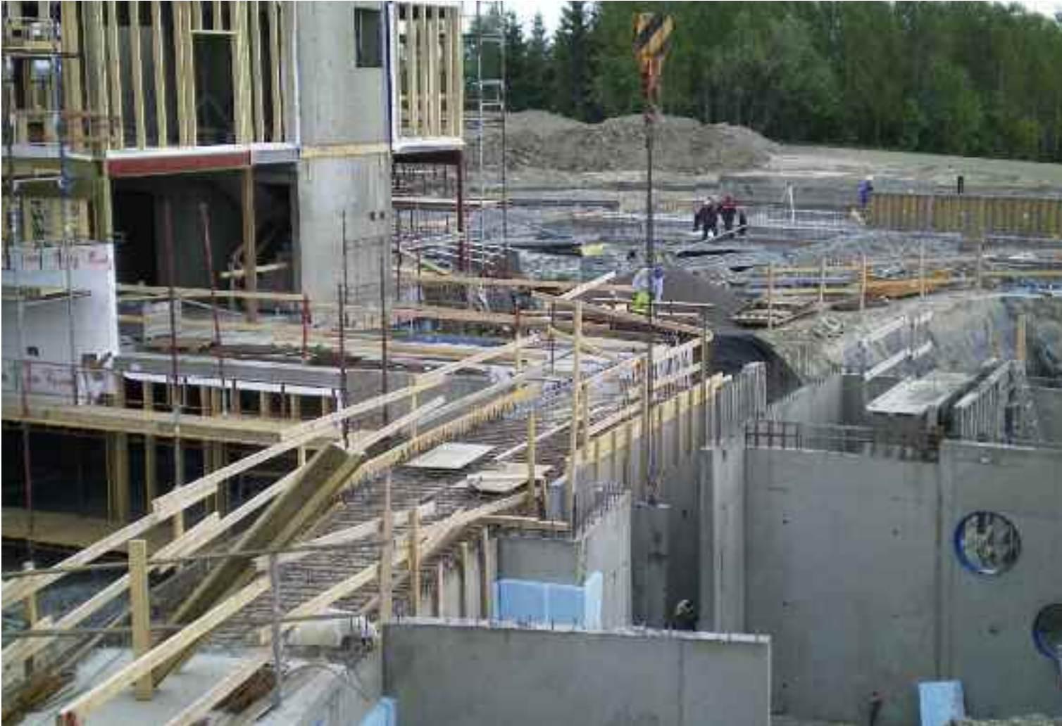
Ø. M. Fjeld bygger bo- og rehabiliteringssenter på Sørvall i Sørum.

sånn at de også får utbetalt akkordetterskuddet sånn som vi andre. Det er jo ikke riktig at faglig dyktige og arbeidsomme folk ikke skal få akkordetterskudd, når de deltar i laget på lik linje med oss andre. For laget er det jo også best at de får etterskuddet sånn som oss. Da yter de jo mer, og så blir akkorden høyere for oss også. Så vidt jeg forstår forutsetter dette at det er en avtale bedriftene i mellom, og vi prøver å få til en sånn avtale. (Se egen faktaboks)