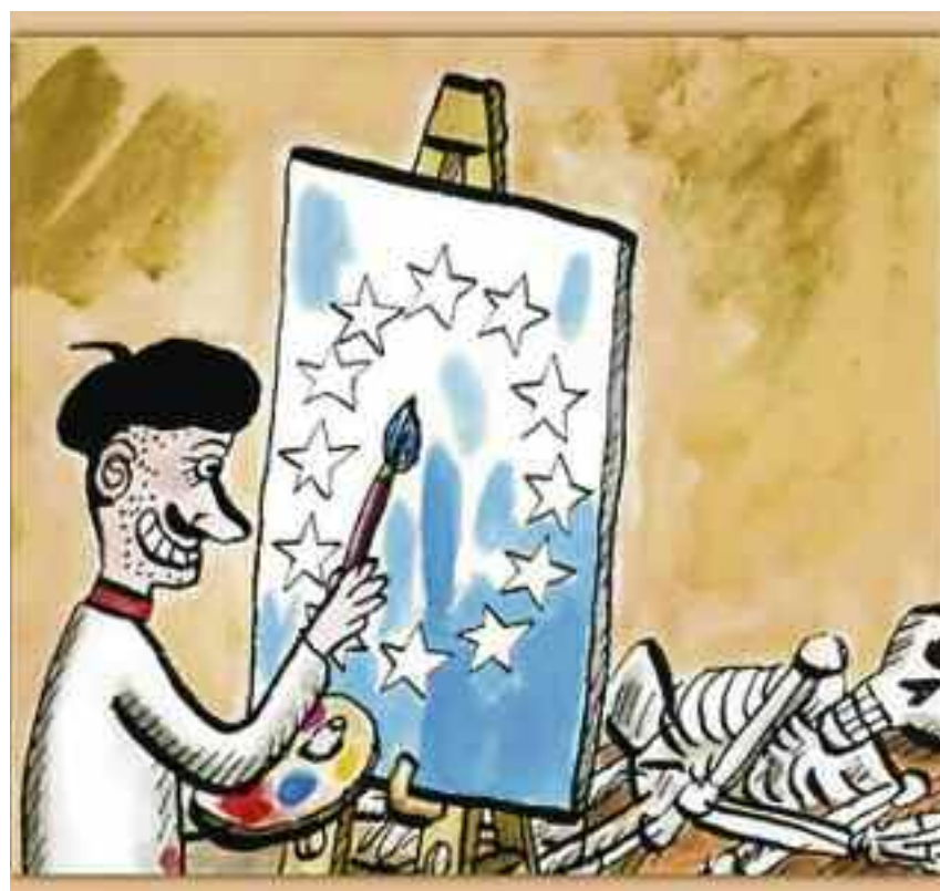
Illustrasjon: Robert Nyberg